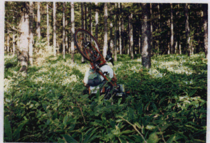
観音平への消失した登山道を見逃して野生バイカーは進む