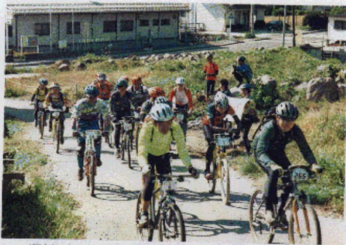
遅刻した2名を残しSS1のスタートはマスドで行われた