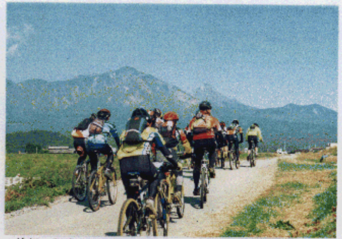
絶好の行楽日和に浮かぶ八ヶ岳に向かって逃走は始まった