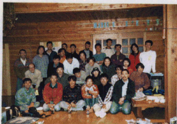
終了後のシャワーもありがたかった国際自然大学校にて