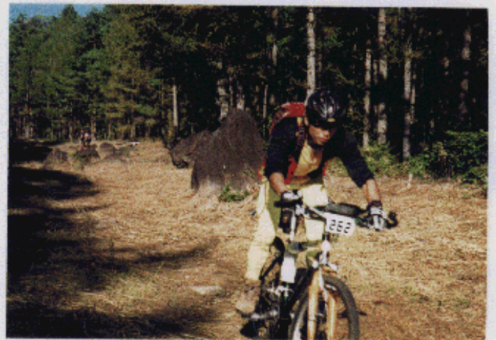
MTB4台横並びで下れる防火帯は誰にも紹介しないぞ