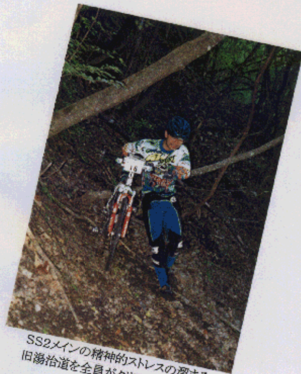
SS2メインの精神的ストレスの溜まる 旧湯治道を全員がクリア